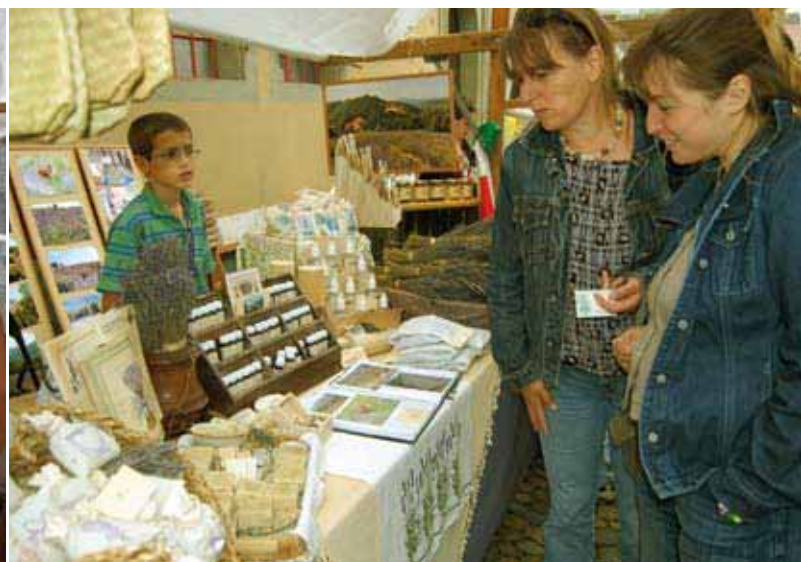
Souvenirs du Bio Marché 2007: Séances de photos avec l'ex-Mister Suisse Renzo Blumenthal, qui était à Zofingue comme ambassadeur d'«Echt Bio». Ou plutôt un savon du stand des cosmétiques naturels et des huiles essentielles?

de savoir jusqu'où le nombre de paysans devrait diminuer pour que ce bilan puisse être amélioré. En effet, diviser ce nombre par deux n'apporterait certainement pas davantage à la population suisse que ça ne l'a fait dans les pays qui nous entourent. On pourrait bien sûr pousser le raisonnement jusqu'à ne plus avoir qu'un seul paysan par commune, par canton ou même pour toute la Suisse... mais ces quelques-uns continueraient quand même de coûter beaucoup trop cher.