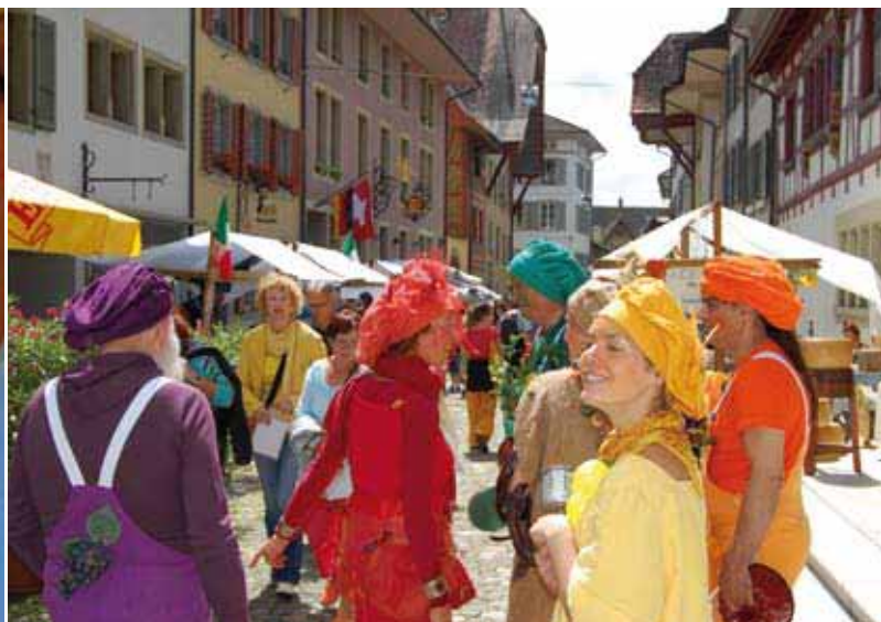
Le Bio Marché animait du vendredi 22 au dimanche 24 juin la paisible vieille ville de Zofingue: 150 exposants ont présenté leurs produits bio à des dizaines de milliers de visiteurs tandis qu'artistes, musiciens et bateleurs détendaient l'atmosphère.