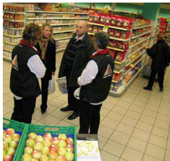
La variété Golden Orange en vente test à la Coop.

Dans nos dégustations, Chouquette et Dalinco sont sensoriellement et optiquement sorties dans la moyenne. On discute aussi beaucoup en France de la variété résistante Ariane , qui pourrait être dans le groupe «rouge», «aromatique, plutôt