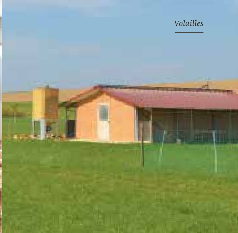
Le système de poulailler d'engraissement fixe de Laurent Godel permet une alimentation automatique.