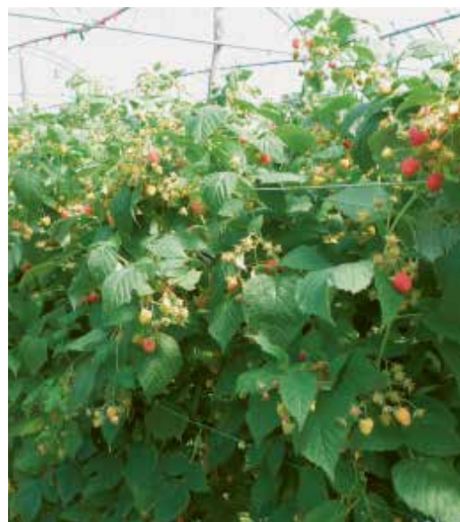
Il y a de très bonnes perspectives d'écoulement pour différentes sortes de fruits bio.

tél. 024 435 10 61, fax 024 435 10 63 courriel info@bioconsommacteurs.ch www.bioconsommacteurs.ch