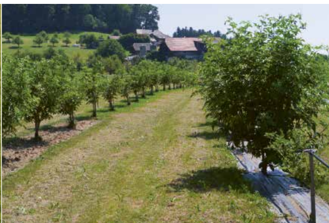
Les trois variantes de travail du sol dans le verger d'essai de Melchnau.

rendements sur les sols travaillés. Et c'est le niveau de fumure avec 60 kilos d'azote à l'hectare qui s'est en moyenne révélé idéal dans les deux fermes. La fumure avec 90 kilos d'azote à l'hectare a quelquefois fourni des meilleurs résultats, mais les différences de rendements n'étaient cependant pas significatives. Les résultats montrent aussi la possibilité d'utiliser davantage d'engrais et de laisser de côté le travail du sol. Il semble en outre que des chaulages faits avec 5,5 t/ha d'Agro-Kalk (Landor, 38 % de calcium) ont une influence fortement positive sur les rendements.