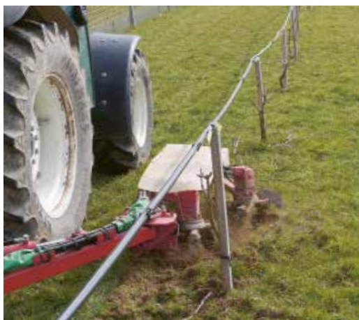
Bineuse Ladurner en plein travail.