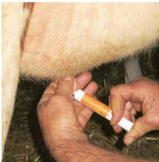
Les modifications du règlement sur les antibiotiques n'entreront pas en vigueur le 1. 1. 2016.