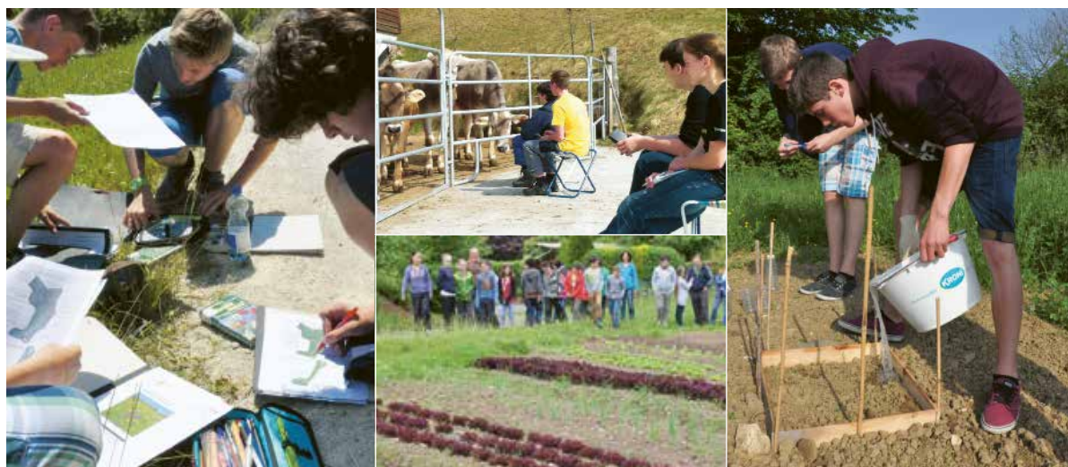
Des élèves de classes d'école en train de rassembler in situ chez les agriculteurs des données sur la biodiversité, la pollinisation, les caractéristiques des sols et le comportement ruminatoire des vaches.

Les concernés (neuf producteurs, dix classes d'école et cinq jeunes chercheurs) tirent un bilan positif après la phase pilote du projet d'éducation à l'environnement «Champs de Savoir».