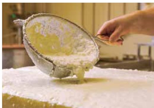
Bientôt davantage de fromage à base de lait de troupeaux sans antibiotiques?