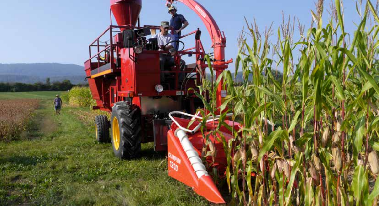
Récolte du maïs d'ensilage de l'essai DOC à Therwil BL.

du lisier stockés en conditions anaérobies, et des engrais minéraux viennent compléter les besoins des cultures selon les normes DBF. Le fumier est enterré par labour dans le système C tandis qu'il est épandu sur le labour et incorporé superficiellement dans les systèmes O et D. L'incorporation superficielle augmente l'efficacité de l'azote. Dans le maïs d'ensilage, les quantités de phosphore et de potassium sont les mêmes pour tous les procédés tandis que la fumure azotée est différente. Le maïs reçoit 281 kilos d'azote par hectare dans le système C, 149 dans le D et 183 dans le O. Le soja des systèmes biologiques ne reçoit aucune fumure tandis que celui des systèmes conventionnels sont approvisionnés en engrais minéraux P et K selon les normes DBF.