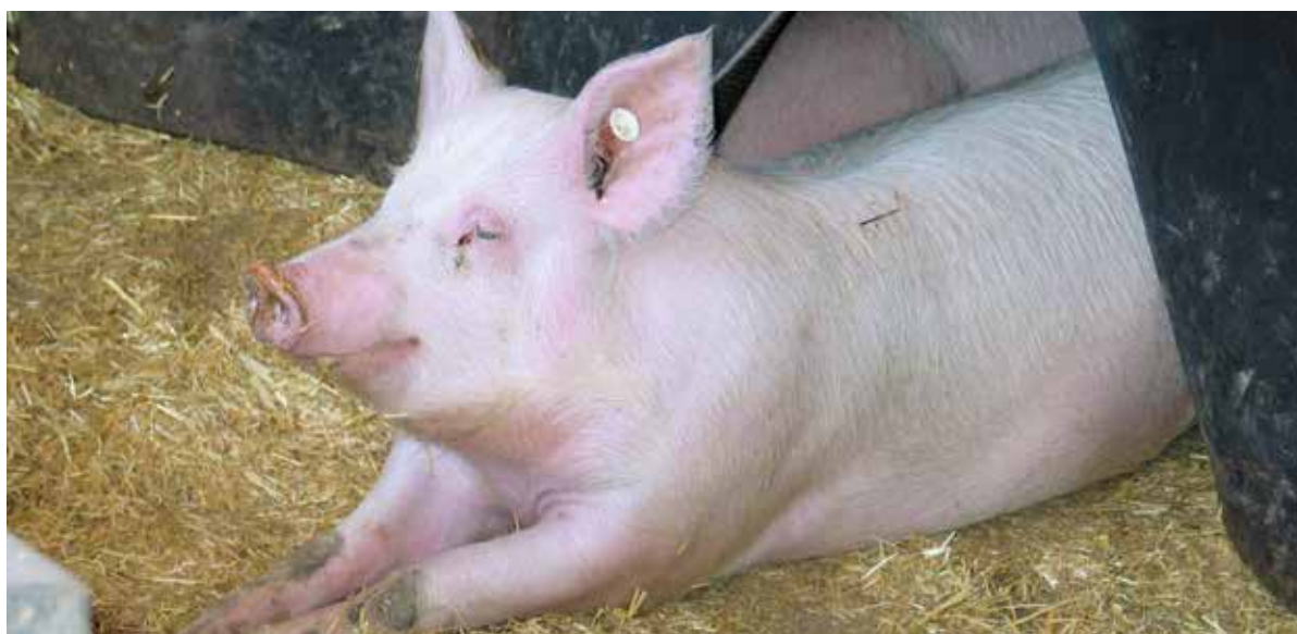
Diminuer les teneurs en protéine brute des aliments sélectionnerait automatiquement un type porcine plus efficace.

L'alimentation 100% bio prévue par la Confédération pour les porcs à partir de 2019 met les producteurs de gorettes et les engraisseurs devant de gros défis. Le FiBL et Bio Suisse ont donc lancé avec Agroscope, la HAFL et Suisag un projet qui va tester plusieurs variantes alimentaires et analyser leurs influences sur les facteurs de production, la qualité de la viande et de la graisse ainsi que l'acceptation par les consommateurs. Ce projet qui démarre en 2017 doit fournir des réponses importantes d'ici l'introduction de l'alimentation porcine 100% bio. Barbara Früh, FiBL