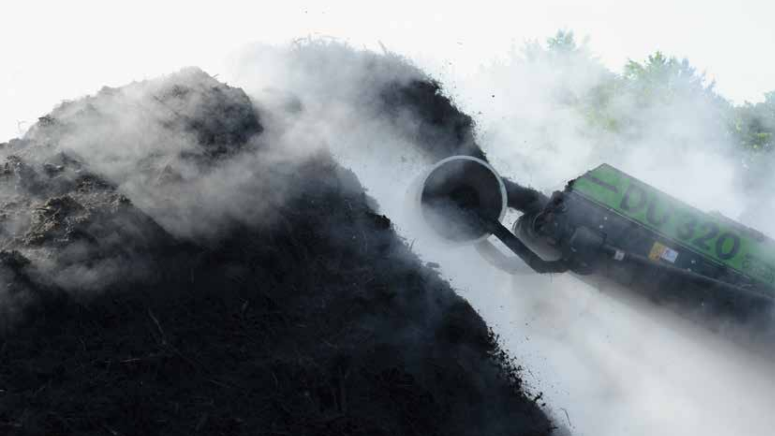
Les compostières disposent d'une mécanisation performante pour retourner les andains.

lors de l'épandage. Par ailleurs, vu que son azote est fixé organiquement à 90 %, un bon compost peut être épandu hors période de végétation, même sur sol gelé (mais pas enneigé).