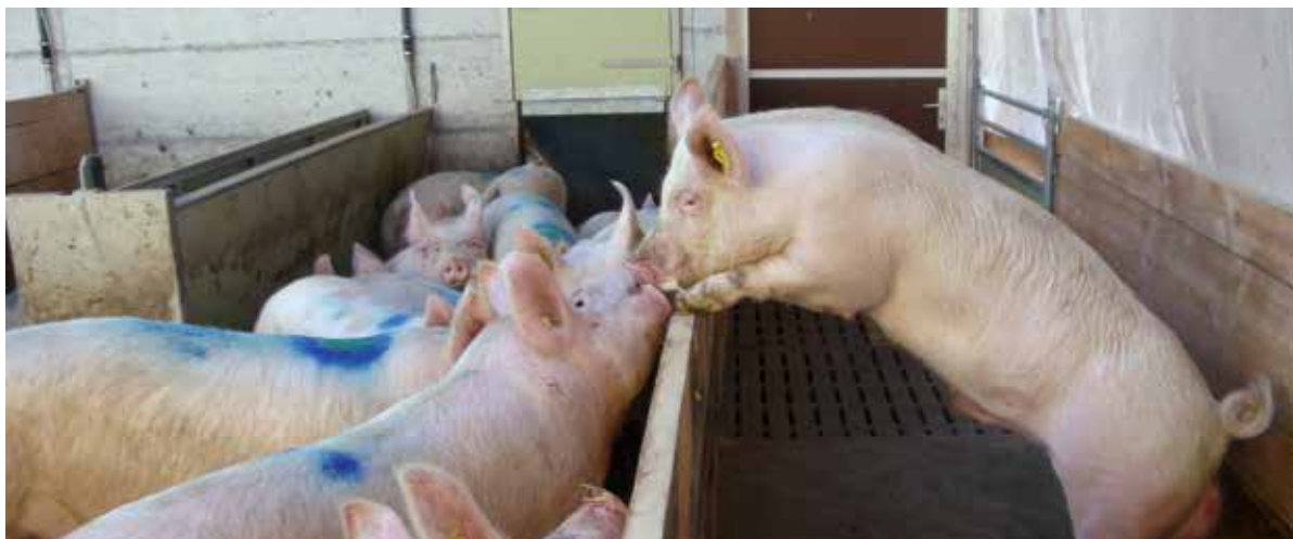
De nombreux producteurs bio ont un verrat (à droite) pour favoriser les chaleurs et pratiquer la monte naturelle.