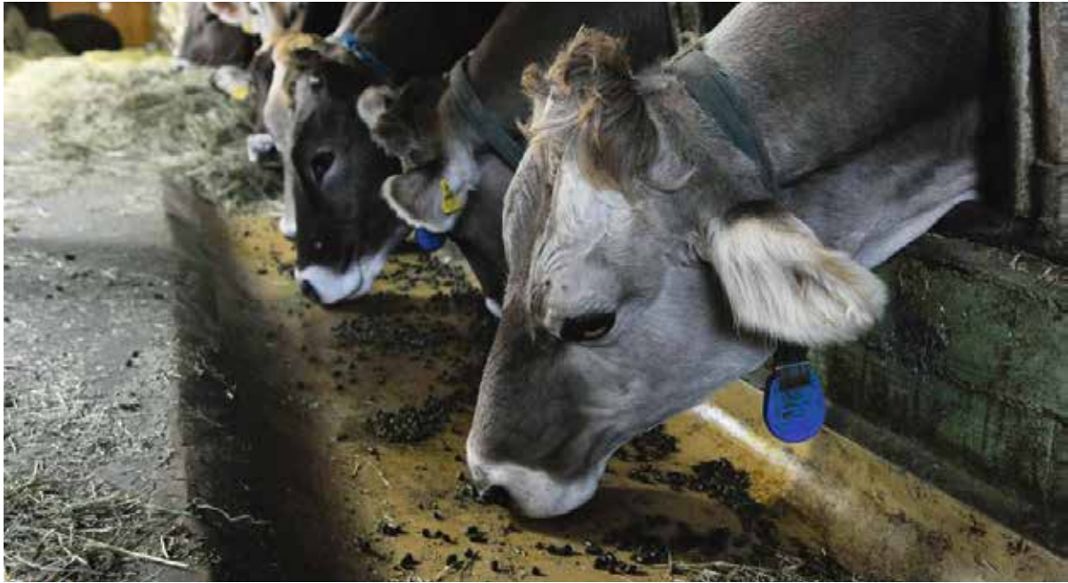
Produire du lait sans concentrés protéiques? Une étude du FiBL montre que ce n'est pas une utopie.