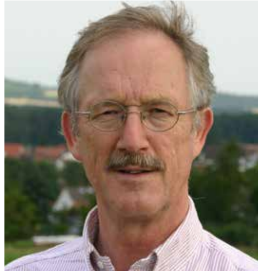
Un critique engagé: Felix Prinz zu Löwenstein.

Premièrement nous devrions évaluer la question des risques. Car finalement la CRISPR/Cas engendre comme les manipulations génétiques classiques des organismes qu'on ne peut plus annuler. Et deuxièmement l'agriculture biologique ne devrait pas utiliser ce genre de technologies. Son objectif est de développer des systèmes stables qui fonctionnent sans inputs extérieurs réguliers. Exemple: Un des espoirs est de pouvoir sauver la production de bananes grâce à la CRISPR/Cas.