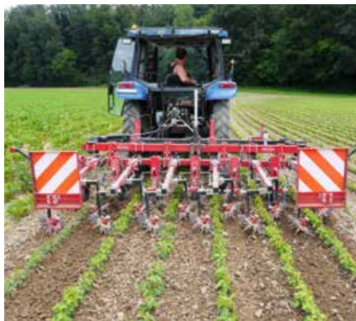
Essai de sarclage dans du soja dans le cadre d'un projet pour les grandes cultures Bourgeon.