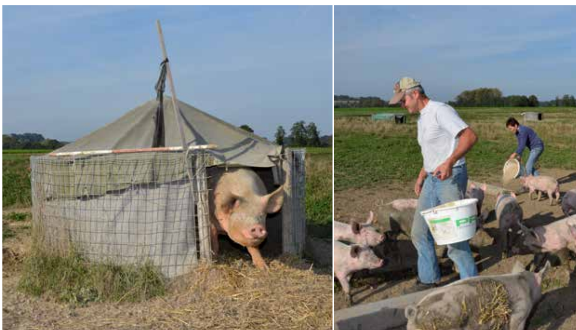
Pas de fumier dans les cabanes... et le pâturage à volonté permet de fourrager sans couinements.