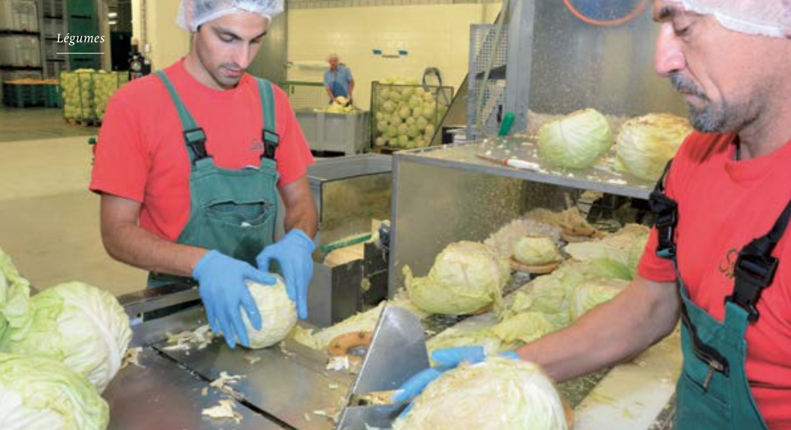
Contrôle des choux: Seuls les choux impeccables vont dans la machine qui enlève les trots.