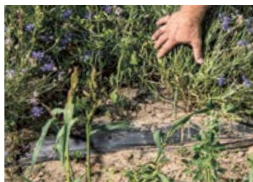
Variante: Planter les fleurs.

Pour Daniel Hangartner, le grand désavantage est évident: «Je vois encore aujourd'hui une augmentation de la pression des mauvaises herbes sur les parcelles de la première année. À l'époque, nous n'intervenons pas dans les bandes fleuries semées et les mauvaises herbes se sont ressemées. Mainte-