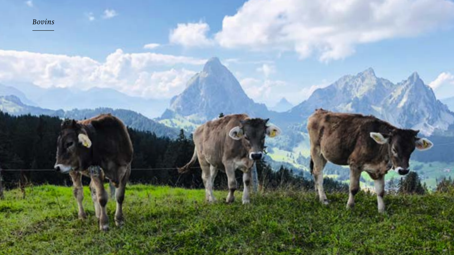
Les veaux d'engraissement bio peuvent atteindre de bons prix – surtout au cours du deuxième semestre.