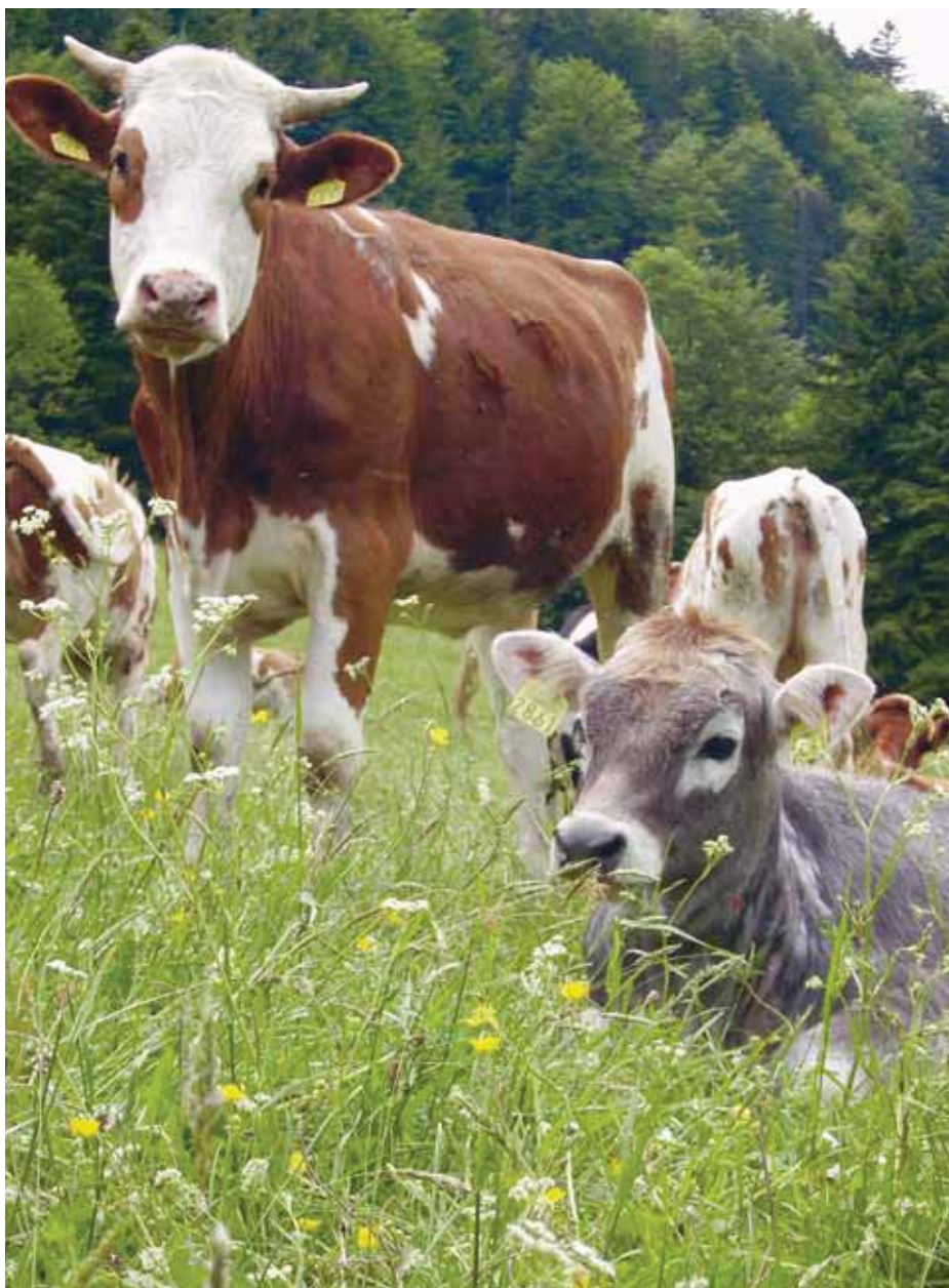
La viande de Bœuf Bio de Pâturage se vend maintenant aussi dans les coopératives Migros Aare et Zürich.

Quand la vente de Bœuf Bio de Pâturage a commencé en Suisse orientale il y a quelques années, il y avait parfois plus de viande que ce qui pouvait être vendu. Qu'est-ce que la