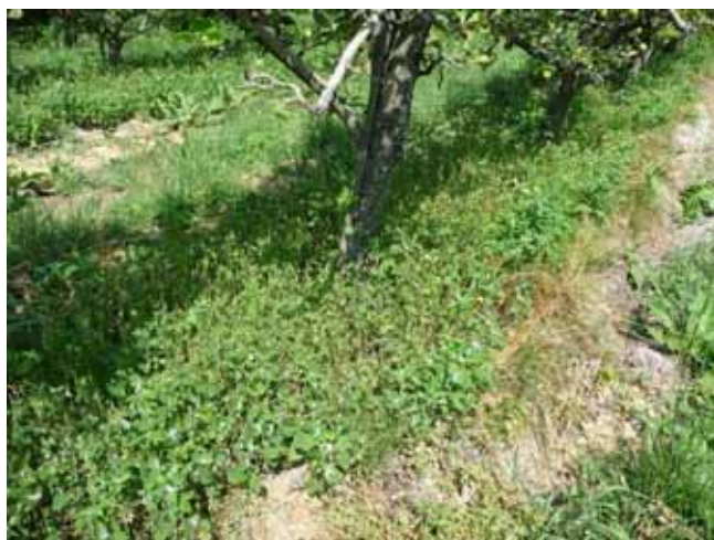
Fauche des chénopodes sur Guyot butté, Saillon, le 4 juillet 2009

25 juin : les chénopodes ont envahi les semis. Pour tenter de remettre les légumineuses au soleil, une fauche est faite à 10cm de hauteur.