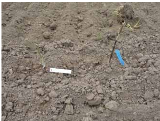
Plantation des greffages sur table

Sur les 2 sites la croissance est faible et irrégulière si bien que le matériel végétal apte à la plantation en automne 2009 est réduit.