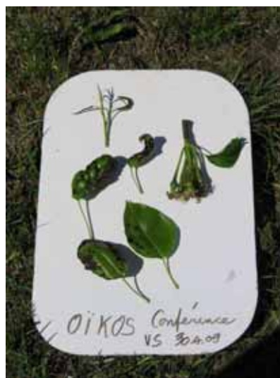
Phytotoxicité sur Conférence, Saillon, le 30 avril 2009