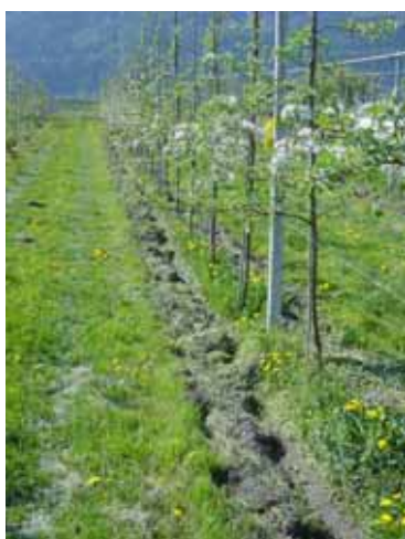
Variante SANDWICH avec bande centrale enherbée