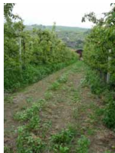
Enherbement sur butte, Uvrier, 23 juillet 2009

23 juillet: les chénopodes ont à nouveau envahi les légumineuses. On décide de faucher une nouvelle fois car les luzernes ont développé une racine de 15 cm en moy. Les lotiers et les trèfles sont également développés sous le tapis de chénopode.