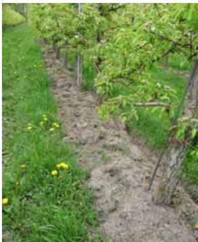
Buttes, Uvrier, avril 2009 levée du mélange légumini un mois après le semis, prédomi- nance des chénopodes.

A Uvrier, le semis de légumineuses a été effectué le 23 avril. Pour allier les avantages du buttage et des légumineuses, ce semis est effectué sous la ligne des arbres préalablement buttés sur une hauteur de 30 cm. Un léger damage est effectué après le semis.