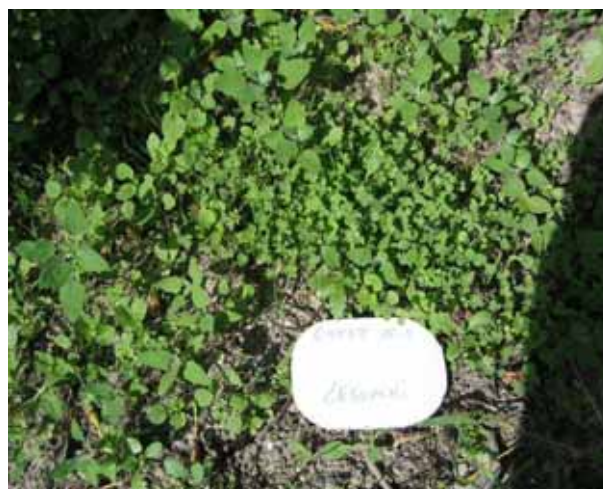
Enherbement légumini Saillon – 26 mai 2009 (semis plus 1 mois)