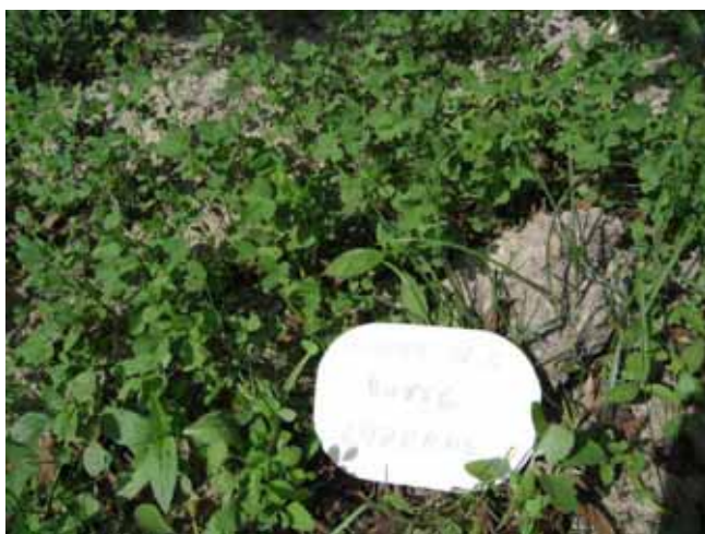
Enherbement luzerne, Guyot, sur butte, Saillon, 26 mai 2009 (semis plus 1 mois)

Au 19 juin le taux de couverture des semis a été estimé à 15-20% dans toutes les variantes luzernes ou Légumini.