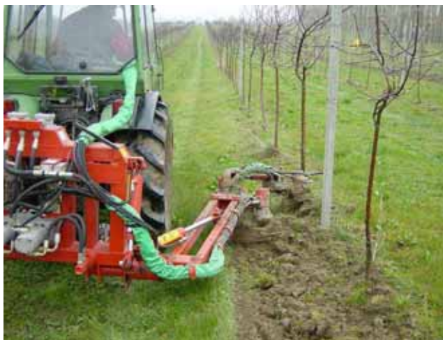
LADURNER en activité sur terrain « sale »

Deux autres variantes de gestion de la ligne des arbres ont été mis en oeuvre à Aubonne comme démonstration : La machine Ladurner et le système Sandwich.