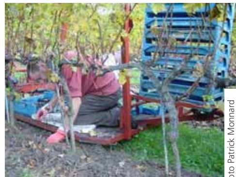
Plateforme de plantation des plants mottés (ici en vigne)