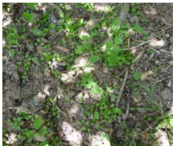
Enherbement légumini, Conférence, Aubonne, 25 mai 2009 (semis plus 1 mois)