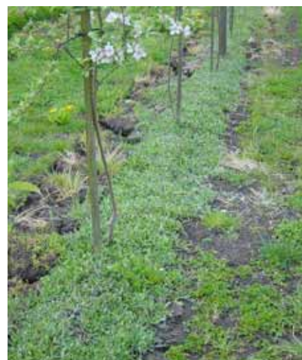
La piloselle couvre la ligne en 12 mois environ