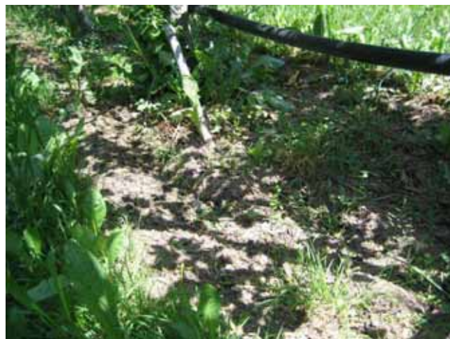
Variante avec LADURNER, Conférence, Aubonne, 25 mai 2009