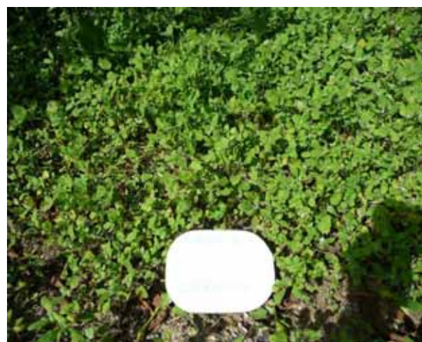
Chénopodes sur Guyot non butté, Saillon, le 4 juillet 2009

Comme à Uvrier, après 2 fauches pour tenter de remettre les légumineuses à la lumière, on doit constater que la pression des chénopodes reste trop importante.