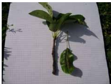
Tavelure sur feuilles et rameaux sur une haute tige peu traité, Louise Bonne, le 7.9.09

Une évaluation des chancres sur bois de 2 ans sera faite dès la chute des feuilles.