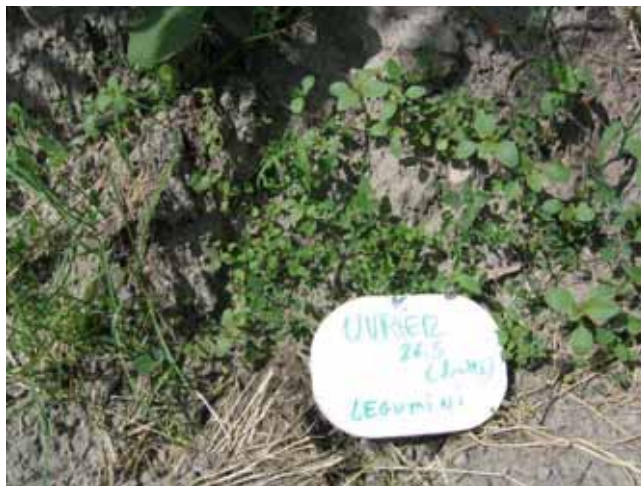
Enherbement légumini, sur butte, Uvrier, 26 mai 2009