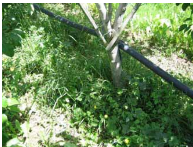
Variante sandwich sur Conférence, Aubonne, 25 mai 2009