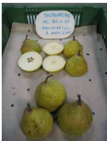
Packhams, Conthey, AC