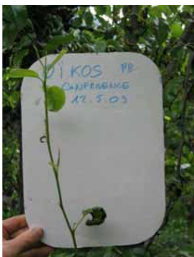
Redémarrage de la pousse, Conférence, Saillon, le 12.05.09

Le 12 mai 2009, on a pu observer un bon redémarrage des pousses, malgré le choc physiologique qu'ont dû endurer les poiriers traités à l'Oikos (photo ci-dessous).