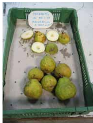
Packhams, Aubonne, AC