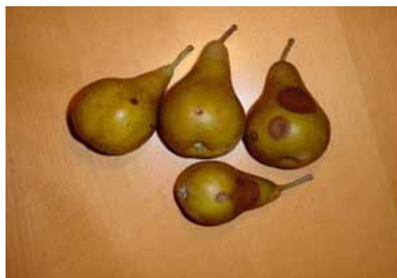
Dégât de Gloeosporium sur Beurré Bosc en sortie de frigo

L'objectif de l'essai dans le projet interreg était de mieux connaître les effets du Mycosin en comparaison avec un standard Cuivre + Soufre sur des Beurré Bosc et des Conférence produites sur une parcelle ayant manifesté des dégâts ces dernières années.