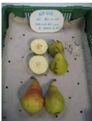
NP 472, AC