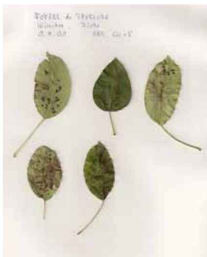
Tavelure sur feuille, William, le 9.7.09

On constate, dans cette évaluation du 9 juillet que les taches de tavelures sont beaucoup plus importantes sur William que sur Louise Bonne.