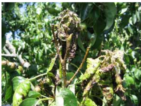
Attaque de pucerons mauves du poirier en juin

Le puceron mauve ( Dysaphis pyri ) est le puceron le plus redoutable dans les vergers biologiques de poiriers. Ils provoquent de gros dégâts dans les vergers en enroulant les feuilles et en produisant un miellat qui souille les fruits. Le NeemAzal T/S (azadirachtine A, 1%, 10g/l) utilisation à 4.8l/Ha, est déjà homologué contre le puceron mauve du poirier, mais pour certaines variétés sensibles, il provoque de graves brûlures sur les feuilles. L'objectif de cet essai est de trouver un produit à base de neem qui ne soit pas phytotoxique pour ces variétés sensibles au NeemAzal T/S. Les tests préliminaires de 2008 effectués avec Oïkos (azadirachtine A+B, 3%, 32g/l) utilisation à 1.5l/Ha, n'ayant pas montré de phytotoxicité sur plusieurs variétés sensibles au NeemAzal T/S, des tests complémentaires ont été conduits en 2009 dans le cadre du projet Interreg.