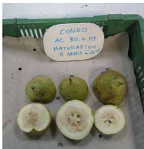
Condo, Brunissement sénescence, AC