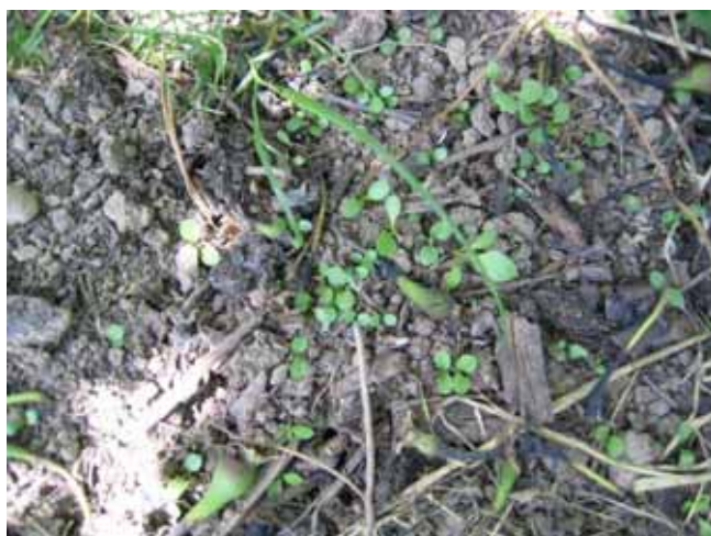
Enherbement luzerne, Conférence, Aubonne, 25 mai 2009 (semis plus 1 mois)