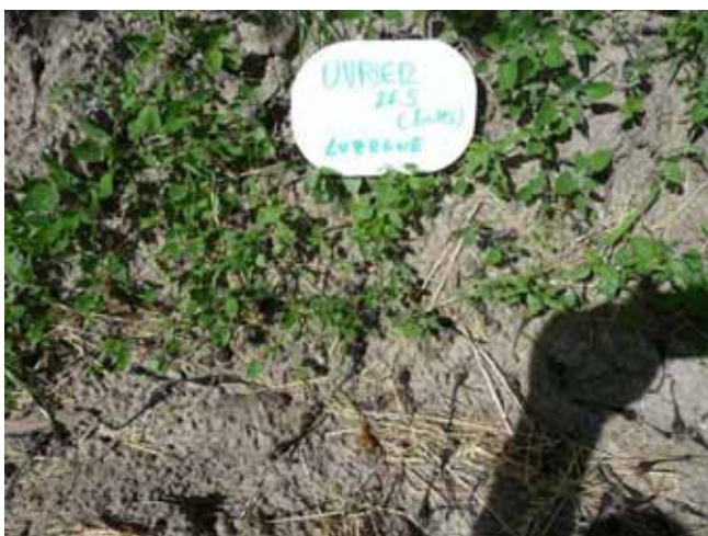
Enherbement luzerne, sur butte, Uvrier, 26 mai 2009