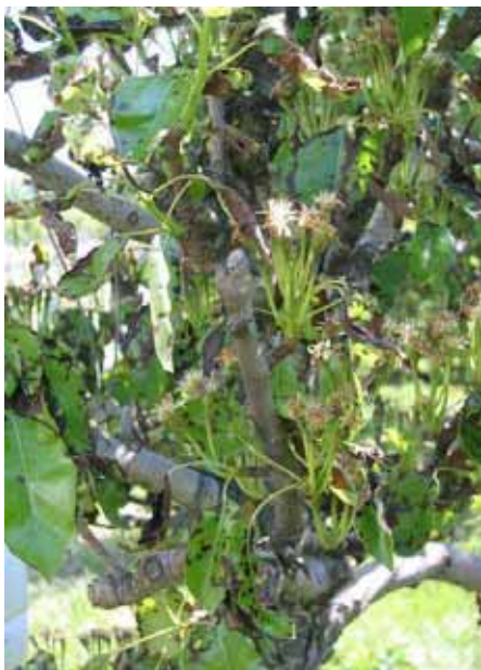
Forte réaction de deuxième mise à fleur sur Guyot, Saillon, le 12.05.09

Ce premier contrôle montre une attaque moins forte sur le verger de Morges en PI avec une pression moindre du ravageur due vraisemblablement aux traitements chimiques plus efficaces des années antérieures.