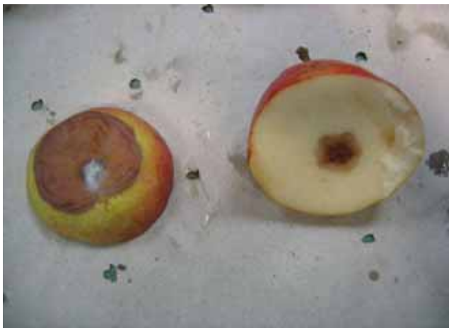
Hortensia, Pourriture due au Gloeosporium, AC, 30 avril 09

L'état général des poires entreposées est qualifié de sain. Le 3 avril 2009, les comptages des fruits prouvent que l'état sanitaire à la sortie des frigos est très bon (Tab 23). On constate un faible taux de maladies dans les variétés Packhams (lot 12) (2% botrytis), Angélis (3% phytophthora) et Conférence (3% botrytis). Le 30 avril 2009, les constatations suivantes ont été faites : il n'y a aucune poire atteinte de maladies dans la variété Packhams. La variété Hortensia (lot 5) présente un taux de maladie de seulement 4% (2% gloeosporium photo ci-dessous 1, 2% autre) alors que Angélis atteint 8% (gloeosporium). Puis, dans l'ordre, vient la variété Conférence (12% gloeosporium), très appréciée des consommateurs. Les variétés NP 472 et Condo ont un échantillonnage très faible, mais toutefois, on peut constater qu'une poire sur quatre de la variété NP 472 est pourrie (25% gloeosporium). La totalité des 6 poires Condo (photo 7) présente un brunissement dû à la sénescence de la chair et de ce fait, ces poires ne seraient pas commercialisables.