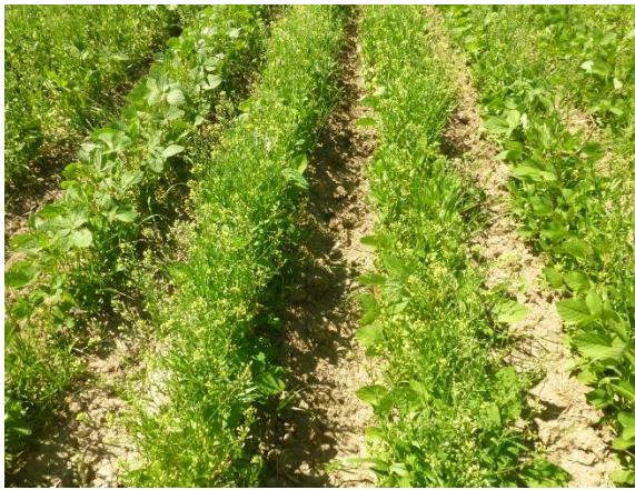
Soja et caméline, Yens, 07.07.2016