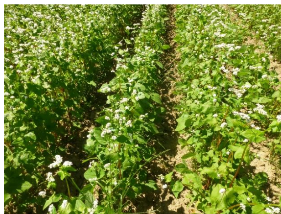
Soja et sarrasin. Le sarrasin est en fleur. Yens, 07.07.2016.