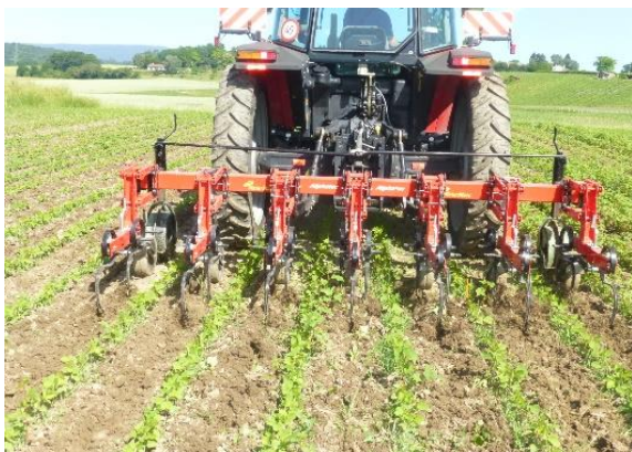
Premier sarclage à Yens le 24.06.2016 avec une sarceuse Maternacc . Seul un interligne de 28 à 30 cm de large est sarclé. Ainsi, les plantes compagnes à proximité de la ligne de soja ne sont pas détruites.