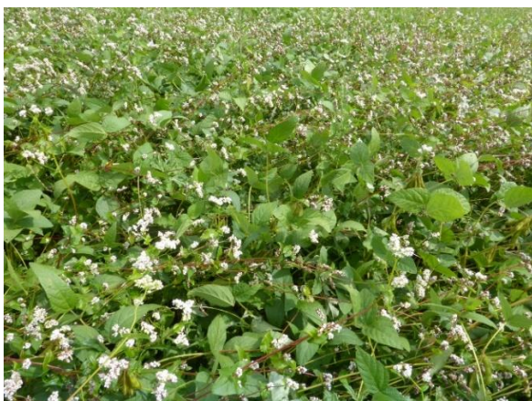
Soja et sarrasin, pas d'adventices. Yens, 20.08.2016