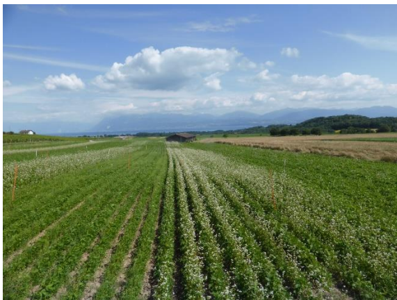
Vue générale de l'essai. Les bandes ayant du sarrasin en fleur sont facilement reconnaissables. Yens, 15.07.2015.