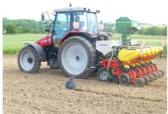
Le semoir à double trémie spécialement conçu par l'entreprise Alphatec pour les besoins de l'essai semé à Yens le 17.05.2016