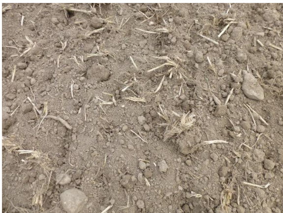
Sol propre, avec résidus de récolte en surface, juste avant le semis (Yens, 17.05.2016)