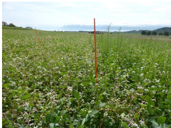
A gauche, soja et sarrasin, propre ; à droite, soja et seigle, beaucoup d'adventices. Yens, 20.08.2016