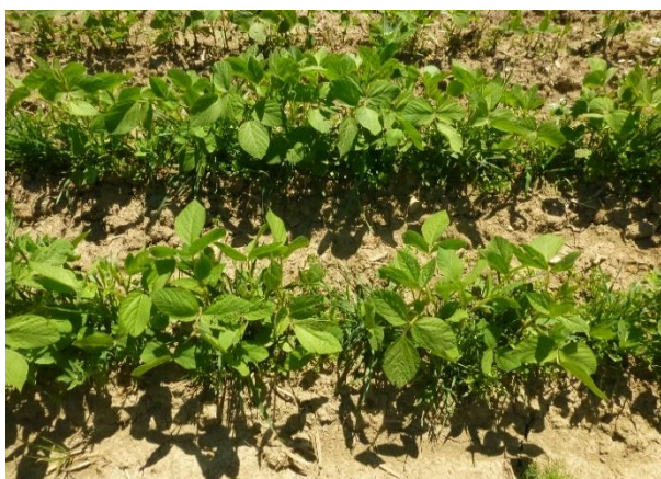
Soja et seigle d'automne, Yens, 07.07.2016

Elle fut mesurée le 15.07.2016 et le 29.08.2016. A fin août 2016, les plantes de soja en culture pure (= procédé 5) étaient légèrement plus longues que les plantes de soja associé.