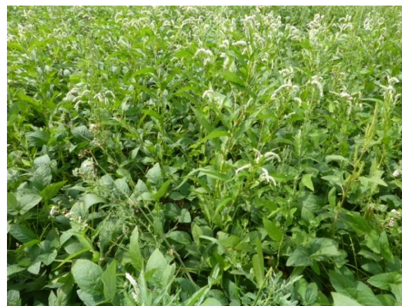
Soja et seigle, beaucoup de renouées dépassent le soja. Yens, 20.08.2016