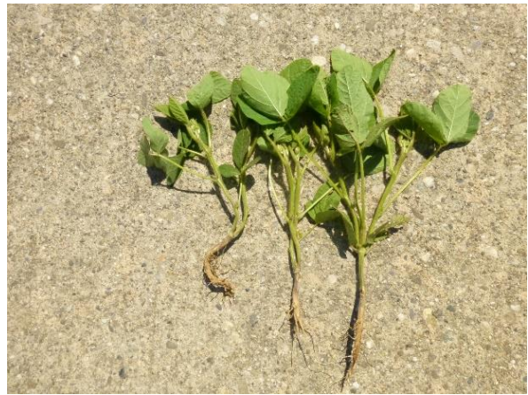
Plantes de soja affaiblies, avec bourgeon terminal détruit, qui ont reformé plusieurs tiges de remplacement. Yens, 07.07.2016