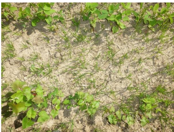
Le soja est chétif car il a poussé en sol asphyxié par les pluies. Les adventices sont nombreuses. Yens, 24.06.2016, juste avant le 1 er sarclage.