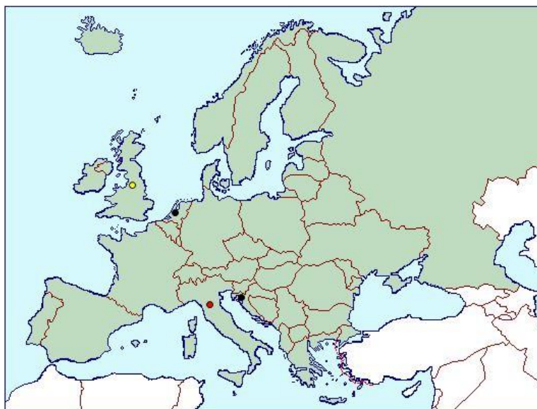
Carte de répartition actuelle (Cabi)

Répartition: Contrairement à son nom d'espèce, la chrysomèle du romarin est originaire du pourtour méditerranéen. Ses plantes hôtes (principalement la lavande et le romarin) étant des plantes populaires des jardins, elle a été déplacée par leur intermédiaire hors de sa zone native et une fois introduite, elle s'est rapidement dispersée naturellement. On la trouve maintenant dans de nombreux pays Européen : Italie, Croatie, Pays-Bas, France et en particulier en Angleterre où elle est maintenant bien établie. Elle a récemment été signalée en Israël.