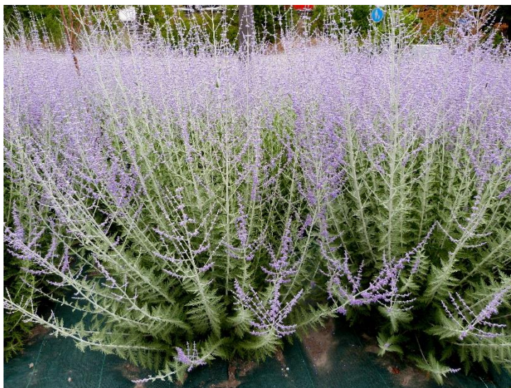
Perovskia atriplicifolia , Sauge de Russie

Autres : Salvia spp., Thymus spp., Perovskia atriplicifolia (Sauge de Russie)