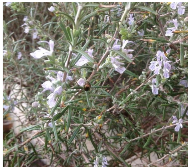
Observations dans jardin à Zürich sur sauge et romarin