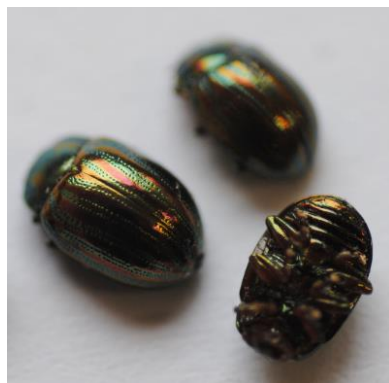
Chrysomèle adulte