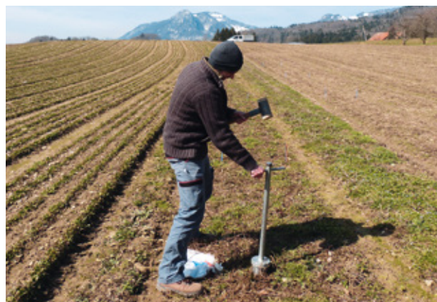
Figure 2 | Mesure de la densité apparente du sol dans l'essai de Mentha x piperita var. citrata . Attiswil, le 22 mars 2013.

Les analyses statistiques ont été effectuées avec le logiciel open source R (version 2.14.1) sur cinq répétitions pour la parcelle principale de menthe orangée et quatre pour les parcelles de menthes pomme, marocaine et poivrée (blocs complètement randomisés). Le test de Tukey HSD (ANOVA) a été utilisé pour les analyses agronomiques de rendement, de qualité et des adventices, lorsque la distribution était normale, et ceux de Kruskal-Wallis et Wilcoxon pour les variantes non paramétriques. Les échantillons de sols ont été soumis à un test T à deux échantillons (échantillons dépendants).