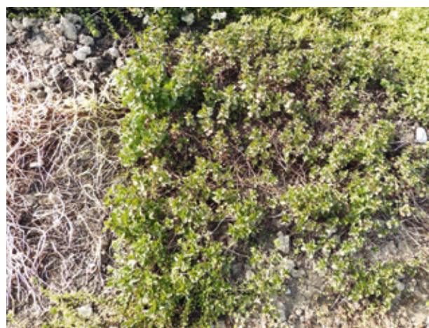
Figure 7 | Conthey, le 11 mai 2015. A droite, bon état sanitaire de la menthe orangée découverte le 14 avril et, à gauche, tiges dépouillées de chlorophylle des plantes découvertes le 11 mai.

1,9 °C à celle d'Agrometeo et surtout inférieure de 12,1 °C à celle au niveau du sol (tabl.7). Ce résultat exclut un effet de solarisation de la couverture sur les adventices. Son action contre ces plantes, plus vraisemblablement, limite la photosynthèse. L'absence de lumière et le microclimat humide sous couverture favorisent probablement l'apparition de maladies fongiques. Les toiles PP forment aussi temporairement une protection mécanique contre l'implantation de nouvelles semences.