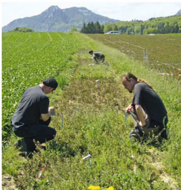
Figure 4 | Relevé de la flore adventice dans la menthe orangee à Attiswil, 8 mai 2013. A droite, deux plates-bandes non couvertes durant l'hiver et, à gauche, la partie couverte, avec une pression malherbologique faible.

Le meilleur climat sous paillage PP joint à l'activité des micro-organismes du sol a aussi favorisé la minéralisation de l'azote, à l'instar d'une couverture neigeuse (Gamache 2014). Au printemps, la teneur en \text{NO}_3^- était significativement plus élevée dans les parcelles couvertes. Le paillage semble avoir aussi limité le lessivage du phosphore et de la potasse. Le rapport C/N était moins favorable dans le sol nu en hiver, mais non signi-