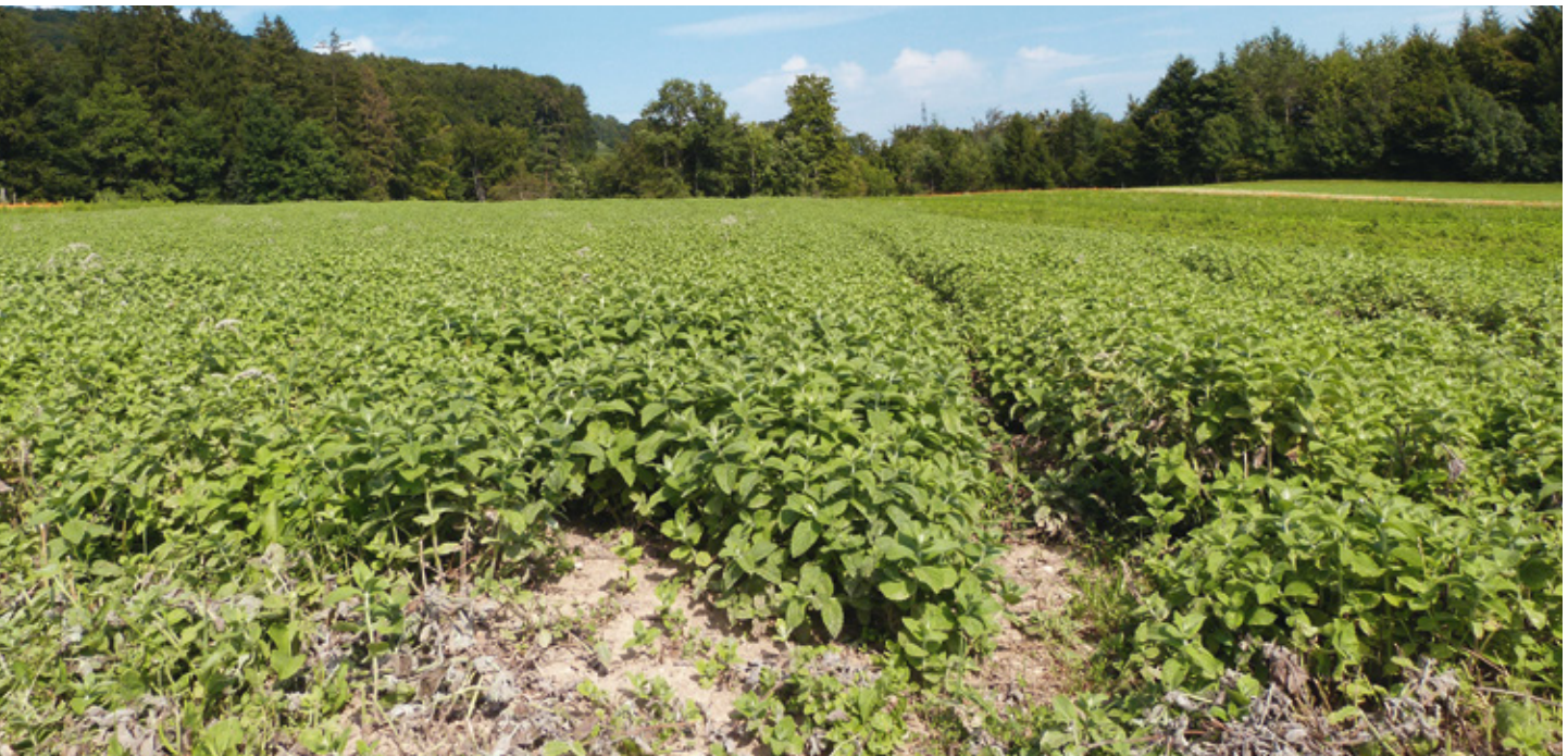
Figure 1 | Parcelle d'essai de Mentha x rotundifolia à Attiswil en juin 2013.

Renseignements: Claude-Alain Carron, e-mail: claude-alain.carron@agroscope.admin.ch , tél. +41 58 481 35 39, www.agroscope.ch