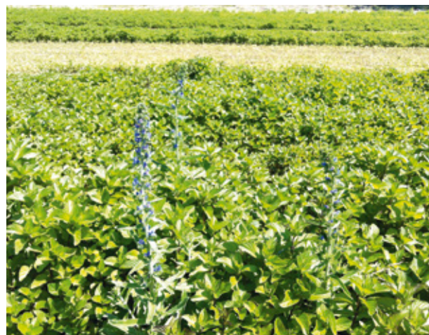
Figure 3 | Parcelle de Mentha x piperita var. citrata , couverte d'un paillage hors-sol tissé en polypropylène durant l'hiver et non désherbée (CS), à Attiswil, le 17 juin 2013. La situation malherbologique est sous contrôle, malgré quelques adventices isolées faciles à trier à la récolte, comme la vipérine ( Echium vulgare ).

L'influence du paillage hivernal PP a été évaluée sur différents paramètres pédologiques. La couverture exerce un effet protecteur sur la structure du sol, no-