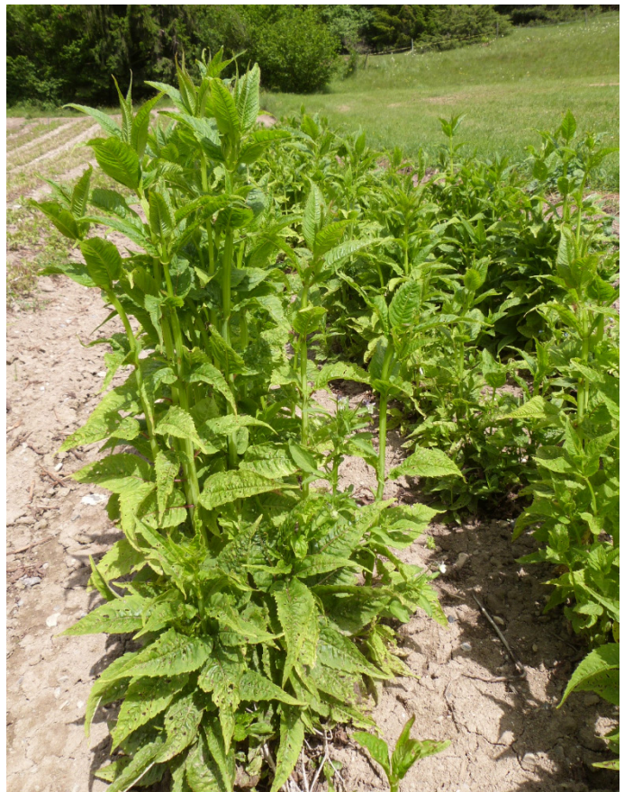
Dégâts de Longitarsus sur Monarda didyma à Ayent