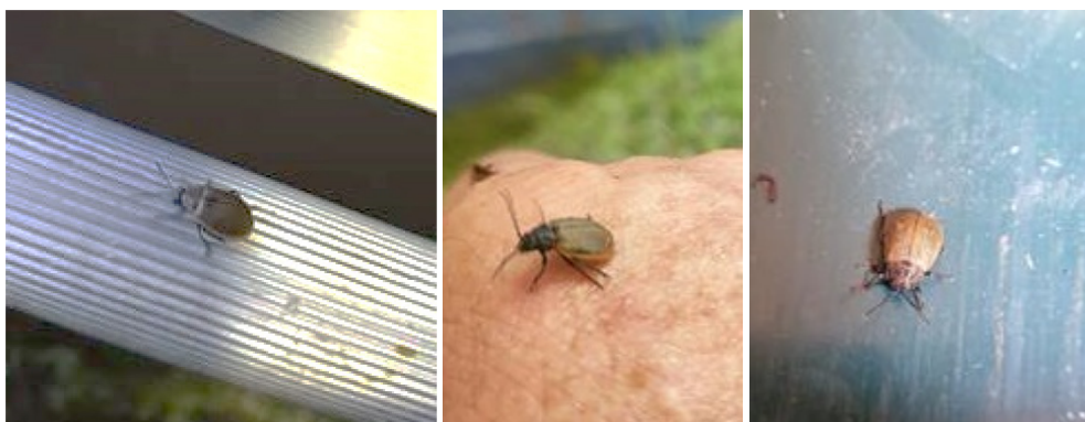
Galéruques à Orvin (BE).

Les insectes n'ont pas pu être déterminés avec exactitude sur la base des photos qui nous sont parvenues. Il s'agit à l'évidence de coléoptères de la famille des Chrysomelidae de la sous famille des Galerucinae . La présence de plusieurs espèces est évoquée.