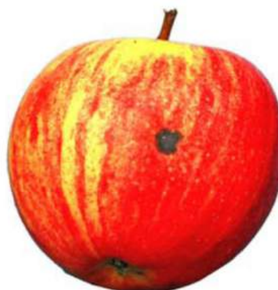
Exemple 2: Taches sur pelure foncée