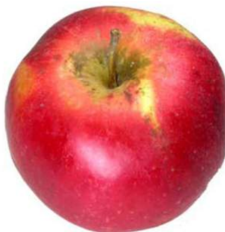
Exemple 2: Taches de suie dans et à l'extérieur du creux du pédoncule sur fond rouge