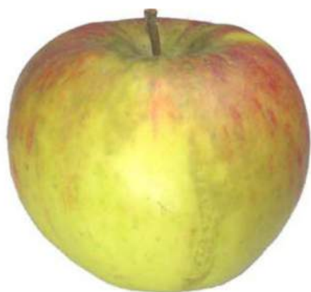
Exemple 3: Taches de suie, fumagine fond sombre