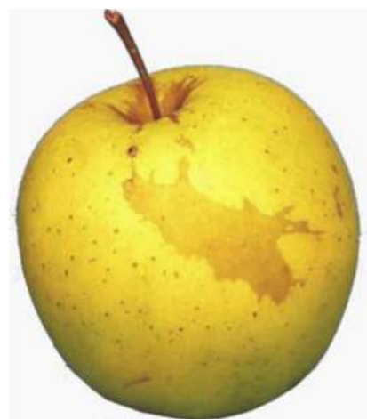
Exemple 2: Roussissure compacte