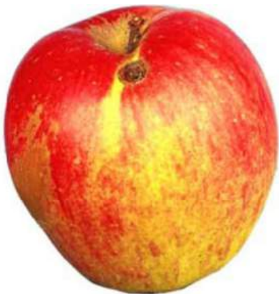
Exemple 1: Traces de morsures cicatrisées