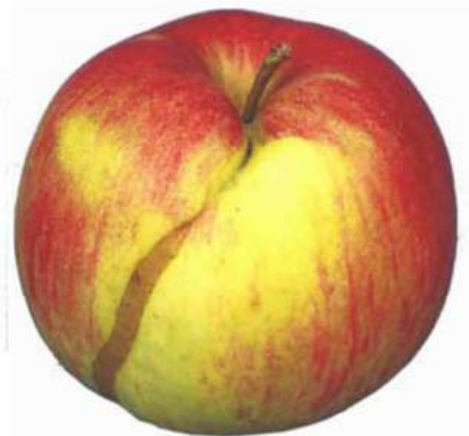
Exemple 2: Traces de morsures cicatrisées