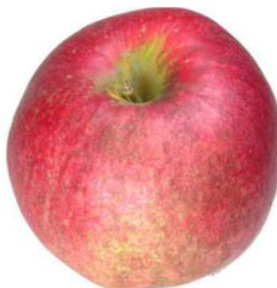
Exemple 4: Fumagine sur fond clair