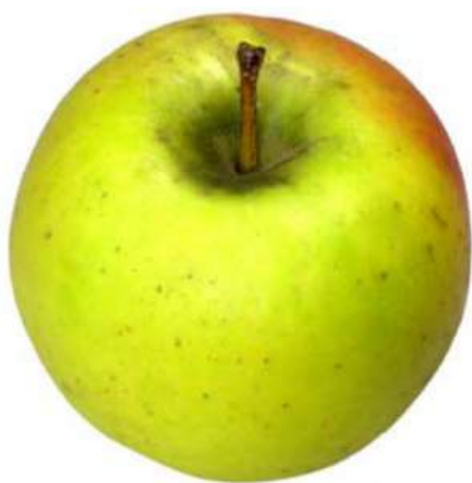
Exemple 1: Taches de suie sur le Creux du pédoncule