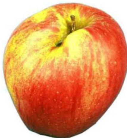
Exemple 3: Traces d'attaques cicatrisées