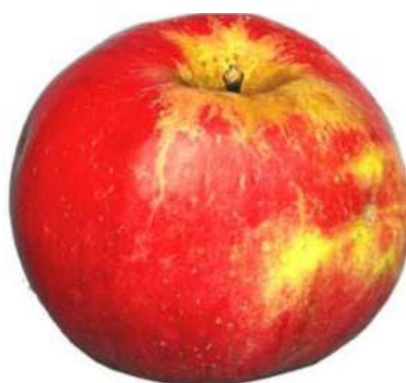
Exemple 3: Roussissure répartie, finement réticulée